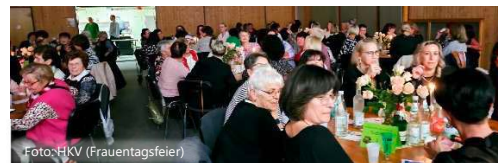
(Frauentagsfeier)