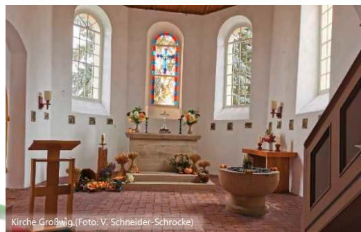
Kirche Großwig

SANIERUNG KIRCHE GROßWIG Das Innere der Kirche in Großwig erstrahlt in einem neuen Glanz. Über viele Wochen waren die Mitglieder des Kirchenbeirates und engagierte Bürger/innen dabei, die Innenwände des Gotteshauses zu streichen, Fenster zu putzen und sonstige Reinigungs- und Pflegearbeiten durchzuführen. Im Außenbereich entstand durch die Bereitstellung von Fördermitteln außerdem eine barrierefreie Zuwegung , die nicht nur sehr nützlich ist, sondern auch optisch das Areal aufwertet.